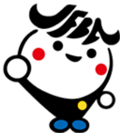
日弁連広報キャラクター ジャブバ