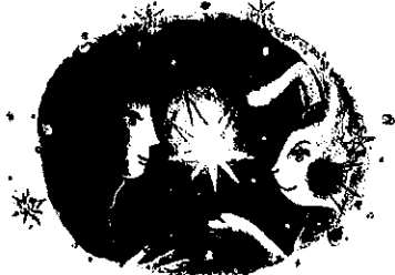
文:かんのゆう 絵:田中鮎子 原作:講談社刊 配給:D&Dピクチャーズ

「星をみがくってことはね、人のこころの中にやさしさをとむすことなんだ。」小さな女の子のリセルは、星の国で出会ったうさぎから不思議なお話を聞きます。深く青い夜の中で出会った、きらめくような出来事。お母さんに絵本の読み聞かせをしてもらうような、やさしいプラネタリウム番組です。(約25分)